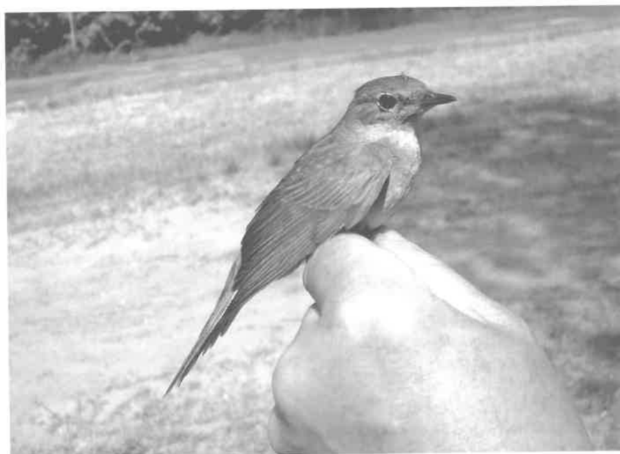
Slavík od koupaliště

V minulém století jsem si přál najít slavíky i za hranicí Středočeského