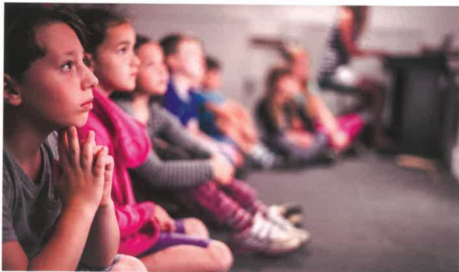
Šrámkova Sobotka.