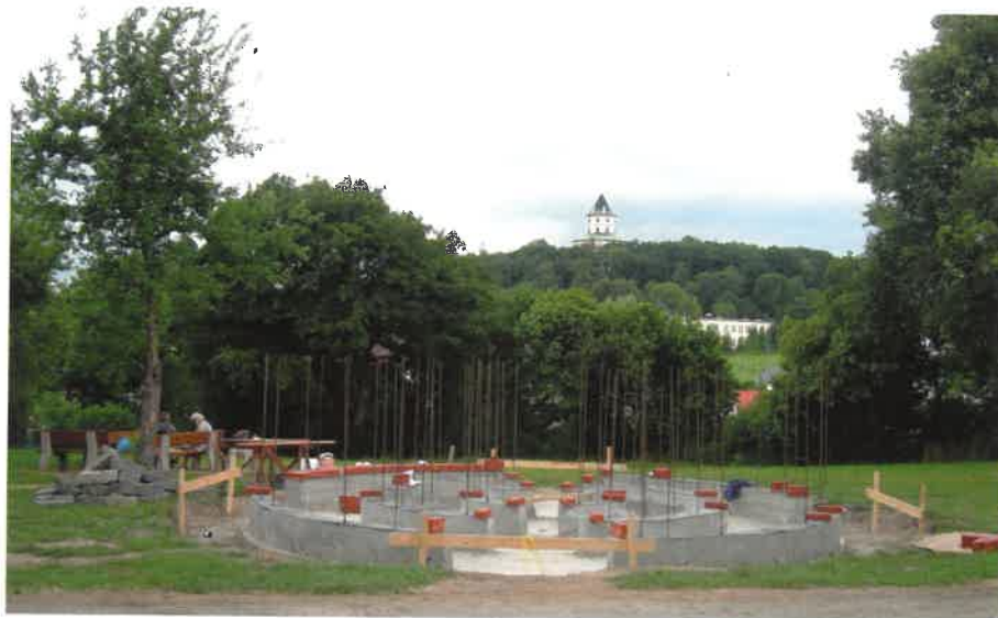
rekonstrukce Parmiggianiho skulptury